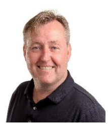
Tor-Arne Aga Skagen Hotel og Eiendom