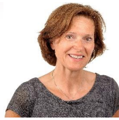
Mona Ågnes Norconsult AS